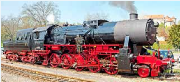
52 7596 (EFZ e.V.)