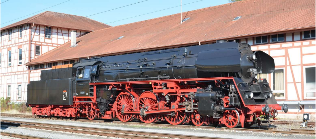
01 519 vor dem historischen Gebäude des Bahnbetriebswerks Rottweil