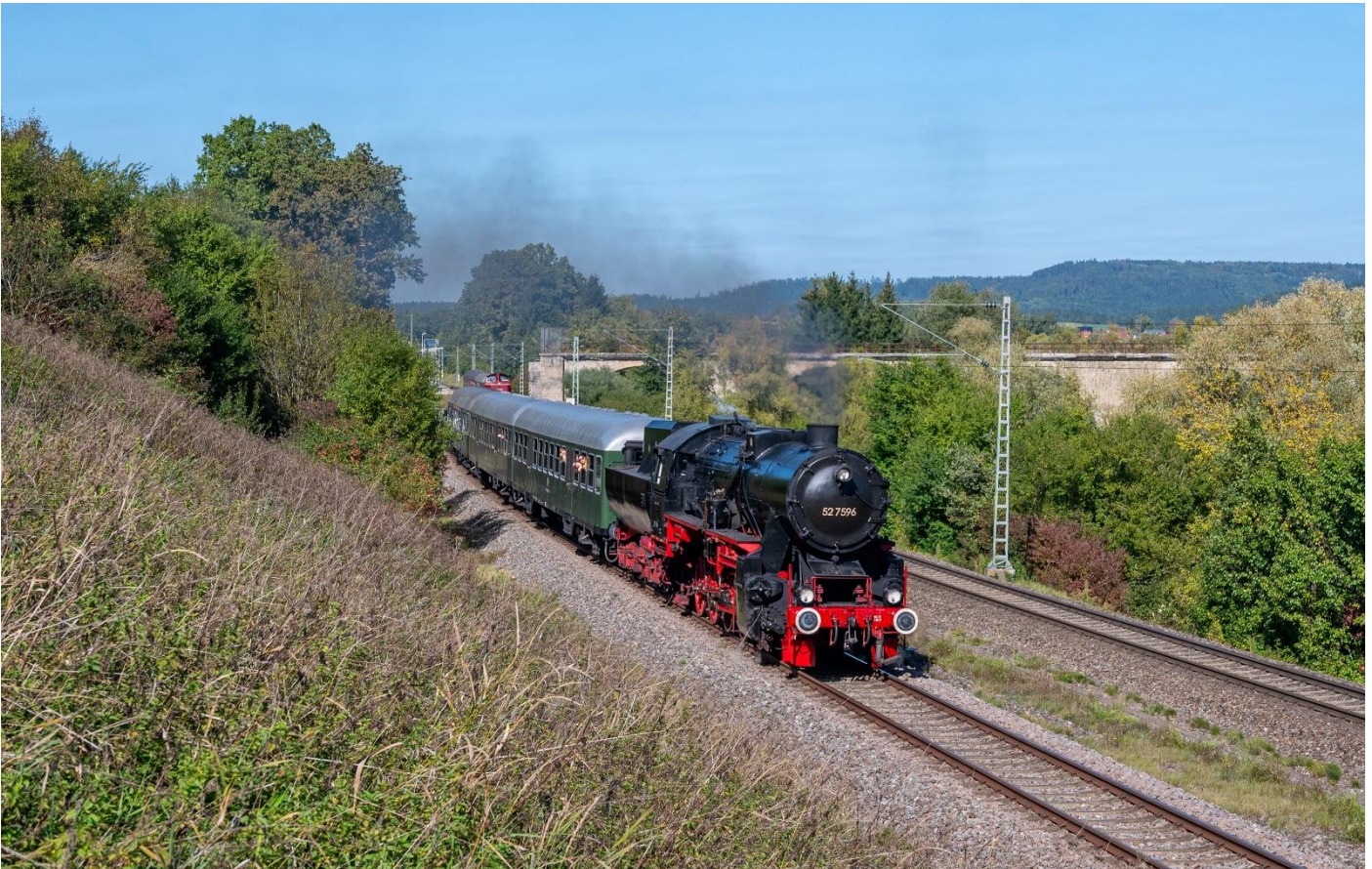
52 7596 am 01. Oktober 2023 mit einem EFZ-Sonderzug zwischen Rottweil und Schwenningen

Eine Veranstaltung der Eisenbahnfreunde Zollernbahn e.V. (EFZ) in Zusammenarbeit mit dem Deutschen Dampflokomotiv Museum Neuenmarkt (DDM)